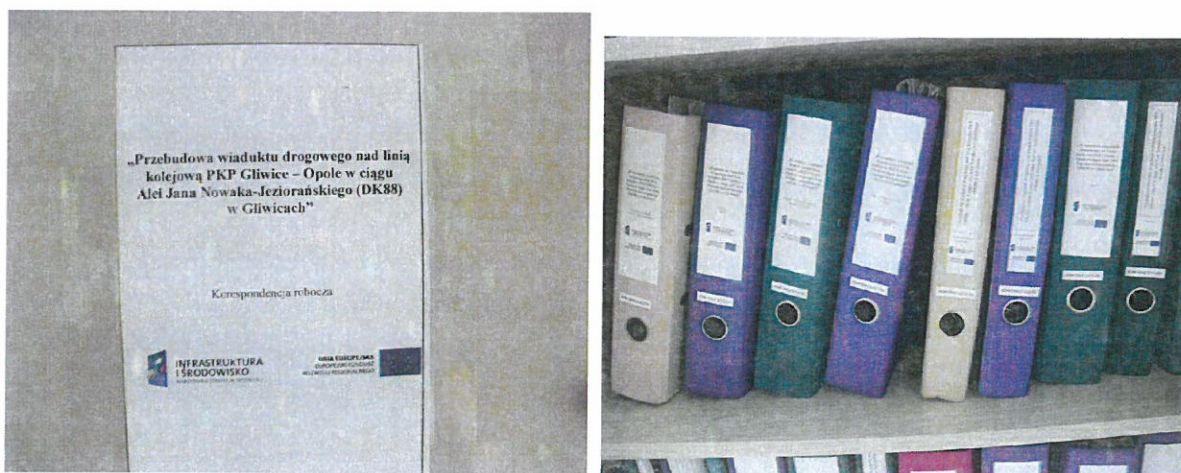
opis segregatorów z dokumentacją Projektu